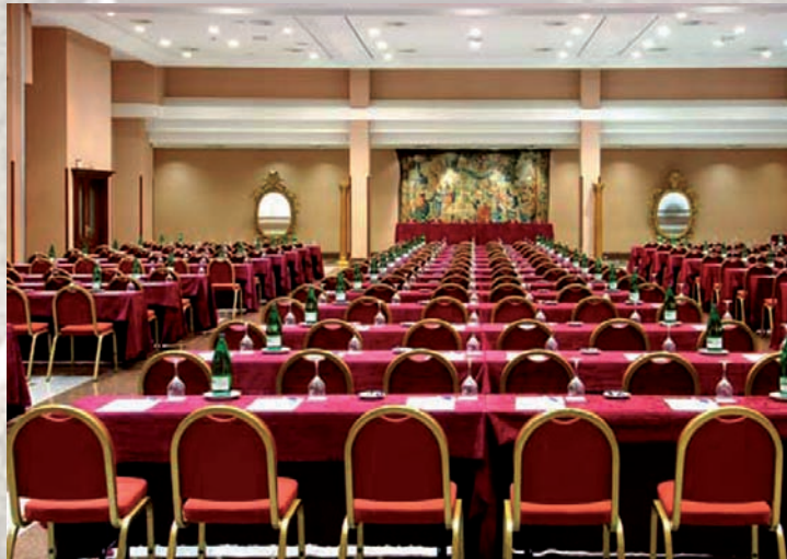
Salón de juego para el torneo 2010

Será al finalizar la última ronda, no siendo los premios acumulables. No asistir a este acto significa la renuncia al premio que le pudiera corresponder. Los premios cuyo importe sea superior a 200 euros, podrán ser entregados mediante talón bancario.