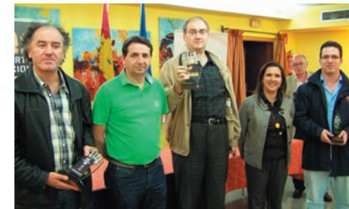
Los tres primeros clasificados del torneo 2009