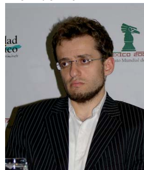
Floja actuación del armenio Aronian, que partía como uno de los favoritos

1. d4 ♜f6 2. c4 e6 3. ♜f3 d5 4. ♜c3 c6 5. ♙g5 h6 6. ♙h4 dxc4 7. e4 g5 8. ♙g3