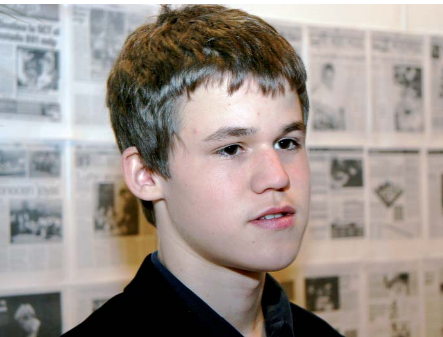
El joven GM noruego Magnus Carlsen que ya forma parte de la élite ajedrecística y se perfila seriamente como un futuro aspirante al campeonato mundial.

De nuevo Carlsen expresa su preferencia por jugar una posición abierta. En la Variante 3.♘c3 ♘b4, llamada Winawer, la partida siempre desemboca en una compleja lucha con carácter marcado claramente como cerrado.